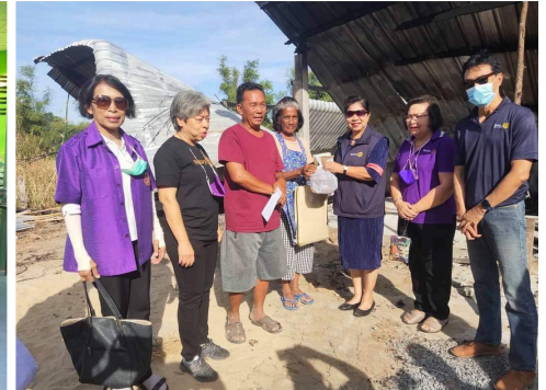
▲ สโมสรโรตารีพระนารายณ์ลพบุรี สโมสรโรตารีลพบุรี สโมสรโรตารีบ้านหมี่ สโมสรโรตารีพระรามนครลพบุรี ช่วยเหลือผู้ประสบอัคคีภัย ม.13 ต.บางลี่ อ.ท่าม่วง จ.ลพบุรี