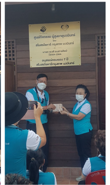
▲ สโมสรโรตารีกรุงเทพ นวมินทร์ ส่งมอบ ศูนย์กิจกรรมผู้สูงอายุ นวมินทร์ ให้กับผู้สูงอายุ ที่หมู่บ้านห้วยแก้ว ต.ดอนเปา อ.แม่วาง จ.เชียงใหม่ เป็นที่เรียบร้อย เมื่อวันที่ 20 มกราคม 2565